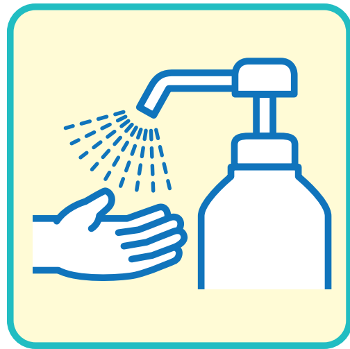
手指のこまめな 消毒の徹底