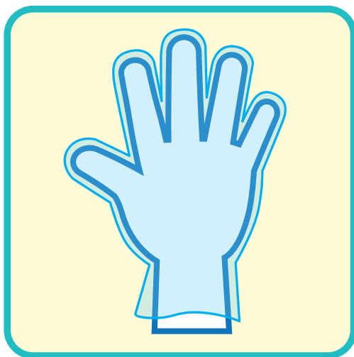
サラダバー、 ドリンクサーバーでの 手袋・マスク着用